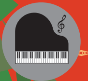
ピアノ 城所 潔