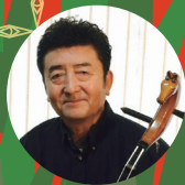
馬頭琴 ライ・ハスロー